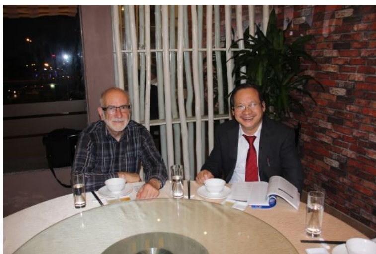
Réunion de travail