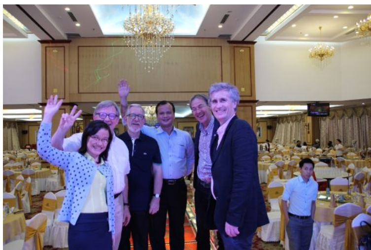
Dîner de gala